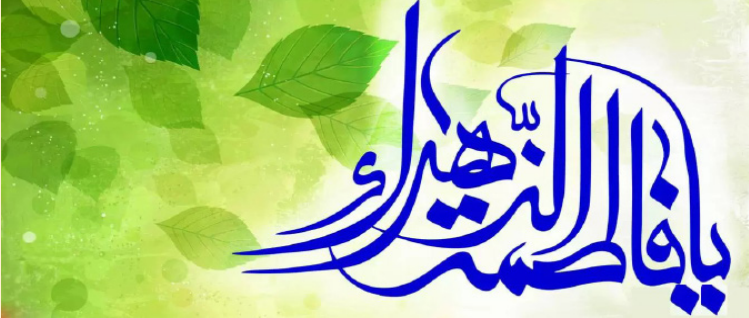
بارز رساله گزیده فارسی زبان (س) سرور ایمان جان، علی‌اندو نه جان، کوروش تان، بهمنی، امیر سرمدان و الگوی این ریل هم بهمان بهمان کلام

بهترین زنان جهان (فاطمه زهرا(سلام الله علیها)) از ماست. و«حالهٔ خطبه» آنکه همین کشد برای دوزخیان از شماسط، یعنی این فضیلت‌ها از ماست و آن زذیلت‌ها از شماسط.» [۶]