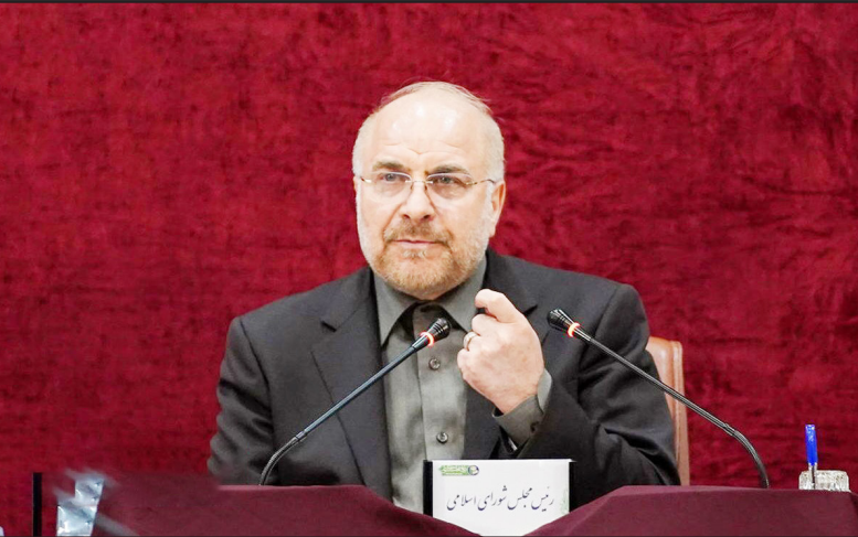
بسام الصباغ وزیر امور خارجه سوریه با محمدباقر قالیباف رئیس مجلس شورای اسلامی دیدار و گفت‌وگو کرد.

و عاقلانه نگاه کنیم، رژیم صهیونیستی موجود نامشروع و مضر به حال کشورهای اسلامی است؛ از ۷۵ سال گذشته که رژیم جانیترکا اسرائیل به دست انگلیس، آمریکا و شورای امنیت شکل گرفت تا امروز ما در جبهه مقاومت با تمام وجود به هدف امنیت و پیشرفت کشورهای اسلامی ایمان داریم و تا آخرین توان پای کار این هدف هستیم و قالیباف یادآور شد: زمانی که کشورهای عربی با سوریه قطع رابطه کردند ما بیش از همه ناراحت شدیم و برای برگشت روابط تلاش کردیم و اقدامات مؤثری انجام دادیم و روزی که روابط احیا شد هم خوشحال شدیم.