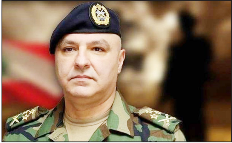
فرمانده ارتش لبنان با اشاره اینکه لبنانی‌ها همواره با قدرت در برابر دشمن اسرائیلی ایستاده‌اند، تأکید کرد نیروهای ارتش همچنان در جنوب لبنان مستقر هستند و وظیفه ملی خود را انجام داده و جانشان را در این راه فدا می‌کنند و وحدت ملی اولویت اصلی ماست.

ایستاده و به وظیفه ملی در دفاع از آنها با وجود همه خطرات و دشواری‌ها ادامه می‌دهد. این مقام نظامی ارشد لبنان خاطرنشان کرد که با آغاز موج آوارگی مردم ما در جنوب، نهاد نظامی کشور با هماهنگی ادارات دولتی برای خدمت به آوارگان پیش قدم شد و کشورهای برادر و دوست نیز دست یاری به ما دادند و بسیاری از لبنانی‌ها نیز در این راه کمک کردند. وی افزود: در یک خط موازی، ارتش به انجام مأموریت‌های خود در سراسر اراضی لبنان ادامه می‌دهد و با همه تلاش‌ها برای بی‌ثبات کردن امنیت و ثبات مقابله می‌کند؛ زیرا وحدت ملی و صلح مدنی اولویت اصلی ارتش و خط قرمز آن است که هیچکس اجازه عبور از آن را