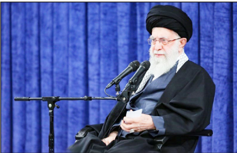
به مناسبت عید سعید فطر، جمعی از مسئولان نظام و سفرای کشورهای اسلامی با رهبر انقلاب اسلامی دیدار کردند.

دریادار تنگسیری با بیان اینکه ما امروز شاهد جایگاه‌هایی در غزه قهرمان و مظلوم، ام‌ال قریب هستیم، افزود: می‌بینیم که بعد از فریب ۶ ماه در واقع دشمنان به اهداف خودشان در غزه نرسیدند. صهیونیست‌ها وقتی که حمله را شروع کردند سه چیز را در واقع به عنوان موفقیت خودشان در عملیات دانستند. اول نابودی حماس، ولی امروز حماس قوی‌تر از روزهای دیگر هست و کمترین ضربه را حسایت خود، دوم شکست روحیه مردم ولی ببینید این مردم شهید می‌دهند، خانه‌هایشان خراب می‌شود اما محکم و مقاوم ایستاده‌اند. بر بدن عزیزان‌شان نماز می‌خوانند اما توکل به خدا را فراموش نمی‌کنند. این‌ها یعنی اینکه نتوانستند مردم مقاوم و مومن غزه را و فلسطینی‌ای قهرمان را بشکنند. سوم دنیا بر علیه آنها شد. فرمانده نیروی دریایی سپاه خاطر نشان کرد: