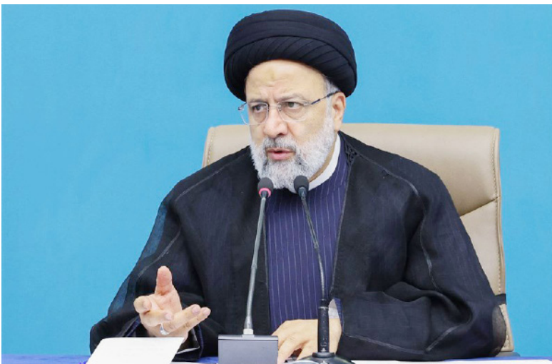
رئیس جمهور گفت: دولت بر حفظ و جذب استعدادهای کشور در حوزه اقتصاد دیجیتال و برداشتن گام‌های بلند در زمینه هوش مصنوعی تأکید دارد.

«استفاده از ظرفیت بخش خصوصی به‌عنوان بازوان پرتوان دولت در تأمین امنیت شبکه در ارتباط با بخش‌های رسمی»، «تأکید