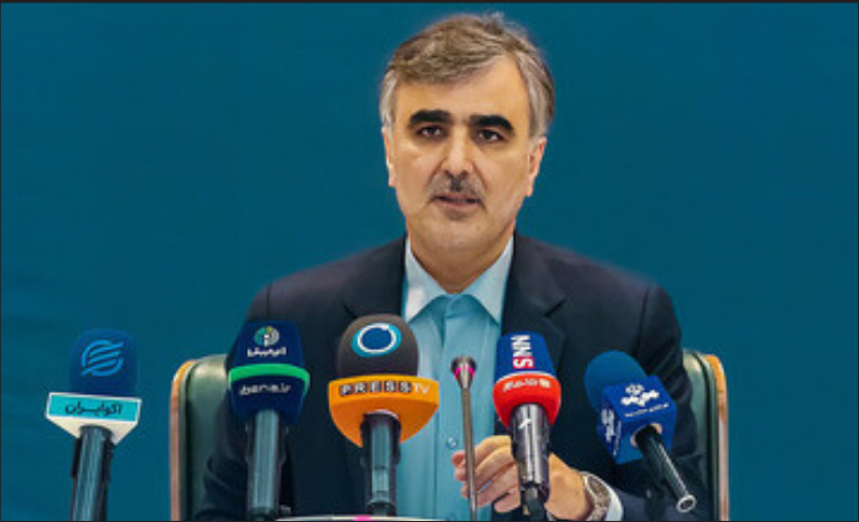
رئیس کل بانک مرکزی ضمن تأکید بر اینکه کسی اجازه ندارد برای مبادلات کشور از ارز دیگری جز ریال استفاده کند، گفت: به دلیل تحریم‌ها به جای سونیت از ابزارهای دیگری استفاده می‌کنیم و ابزار مالی خودمان را داریم، چه اشکالی دارد که FATF خودمان را داشته باشیم.

دارند. چشم‌انداز ما نشان نمی‌دهد که در آینده تجارت خود را با غرب افزایش دهیم. یا مرادوات مالی خارج از تجارت داشته باشیم. کشورهای شرقی از جمله چین و هند تجارت خود را گسترش دادند و ما می‌توانیم با این کشورها تجارت کنیم. اکنون به‌دلیل تحریم‌ها به جای سونیت از ابزارهای دیگری استفاده می‌کنیم و ابزار مالی خودمان را داریم، چه اشکالی دارد که FATF خودمان را هم داشته باشیم؟ وی با بیان اینکه بخش عمده تجارت با کشورهای همسایه است، افزود: ما هم با توجه به تأکید دولت سیزدهم و رئیس‌جمهور بر تقویت ارتباط با کشورهای همسایه، باید روابط مالی و تجاریت خود را با کشورهای همسایه