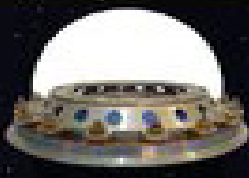
پرتاب ماهواره پارس ۱