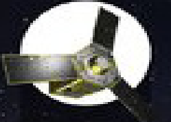
پرتاب ماهواره سنجشی خورشید آهنگ