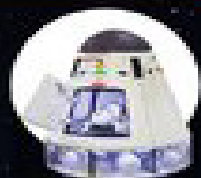
پرتاب کپسول زیستی