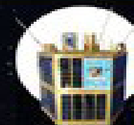
پرتاب ماهواره‌های ظفر ۲