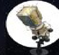
پرتاب بلوک انتقال مداری سامان ۱