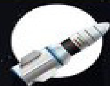
پرتاب ماهواره پارس ۳

برنامه‌های در دست اقدام سازمان فضایی کشور تا سال آینده