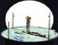
طراحی، ساخت و تکمیل پایگاه فضایی چابهار