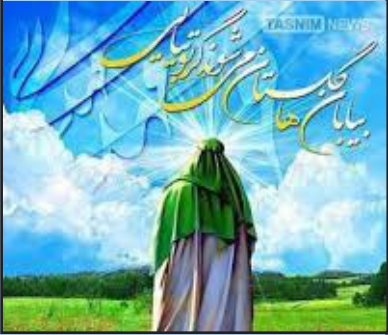
دبیر پژوهش روزنامه سراج