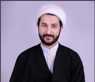
دبیر پژوهش روزنامه سراج

محمود فاطمی هنرمند دوبلاژ ایران یک روز پس از درگذشت همسرش، روز گذشته (۲۶ مرداد ماه) بر ایست قلبی از دنیا رفت. شهردار بانکی- مدیر روابط عمومی انجمن گویندگان و سرپرستان گفتار فیلم در گفت‌وگویی با ایسنا درگذشت این هنرمند دوبلاز را تایید و اعلام کرد مراسم خاکسپاری محمود فاطمی متعاقبا اعلام خواهد شد.