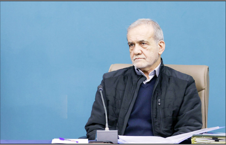
رئیس جمهور گفت: اگر ما در کنار هم و پشت سر مقام معظم رهبری حرکت کنیم همه مشکلات را حل می کنیم.

همه مشکلات را حل می کنیم به شرط این که دعوا نکنیم و بپذیریم مملکت برای همه ایرانیان است. وی همچنین با بیان این که «مملکت برای همه ما و برای تمامی ایرانی ها است» خاطرنشان کرد: اگر این موضوع را بپذیریم مشکلات حل خواهد شد. این که عده ای