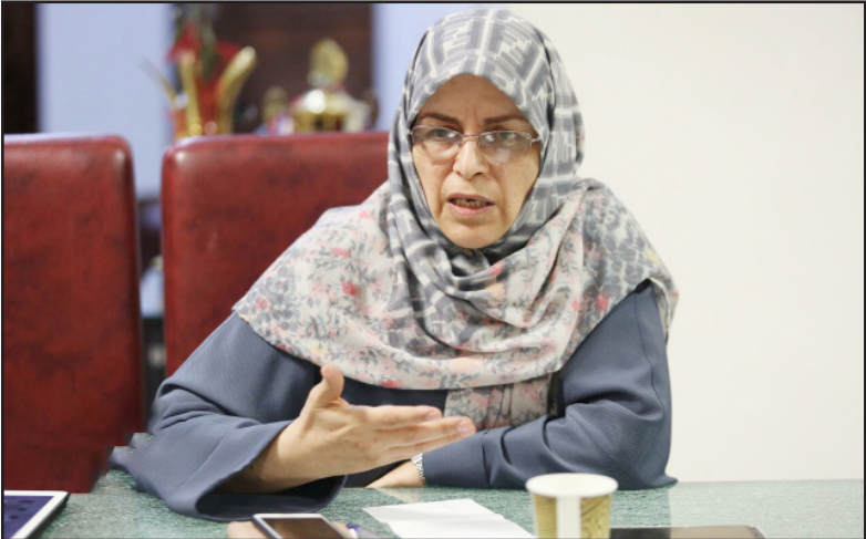
دبیرکل حزب اتحاد ملت ایران گفت: با روی کار آمدن دولت دکتر پزشکیان و تاکید بر وفاق، بیش از هر زمان دیگری باید به این واقعیت پرداخت که بدون شکل گیری تفاهم بر سر حل چالش ها و بحران ها امکان دستیابی به وفاق ممکن نیست.

نسبی شکل گرفت و دکتر پزشکیان یکی از آخرین پیمایش ارزش ها و نگرش های ایرانیان که در ابان ۱۴۰۲ انجام شد، سرمایه اجتماعی که ایران نسبت به چهاردهه اخیر کاهش یافت که نتیجه این پیمایش برای صاحب نظران، پیمای روشن درباره شکاف بین حاکمیت و ملت در طول پس از انقلاب داشت.