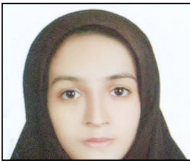
پریالطفی گزافی گرمانشاه