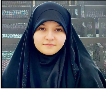
کوثر سیروس هرمزگان جزیره کیش