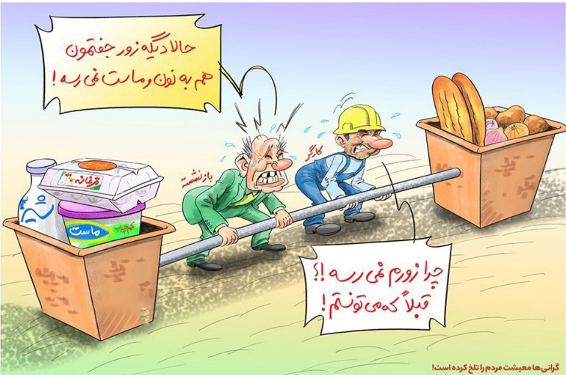
کارگران و دانشمندان دیگر توان خرید شیر و ماست و تخم مرغ را هم ندارند؛ این واقع را خانواده‌های کارگری و لایه‌های پایین‌مدرک‌گیران بر دوش می‌کشند