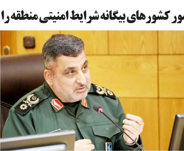
جانشین وزیر دفاع گفت: حضور کشورهای فرمانطقه‌ای شرایط امنیتی منطقه را پیچیده تر کرده و در عین حال هیچ کمکی به ایجاد آن نیز نخواهد کرد.

وی همچنین بر استمرار برنامه احیاء واحدهای تولیدی تعطیل و نیمه فعال تاکید کرد و گفت: احیاء واحدهای تولیدی و بنگاه‌های اقتصادی از اولویت‌های جدی دولت است و علاوه بر آن باید با گرگشایی و کمک به واحدهای تولیدی فعال، ظرفیت تولید و میزان اشتغال آن‌ها را افزایش دهیم. معاون اول رئیس‌جمهور از رونق تولید بعنوان یکی از راهکارهای اصلی مقابله با گرانی و تورم نام برد و استناداران را به ارتباط نزدیک با نخبگان و دانشگاه‌ها برای بالا بردن ظرفیت