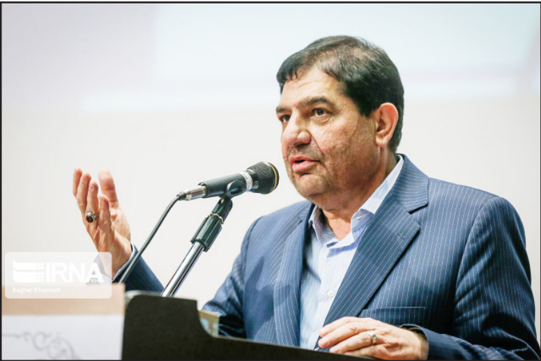
معاون اول رئیس‌جمهور استنادان سراسر کشور را مأمور کرد تمرکز اصلی خود را بر طرح‌ها و پروژه‌هایی معطوف کنند که در رفع مشکلات مردم و پاسخ به مطالبات و نیازهای جامعه بیشترین اثرگذاری را دارد.

محمد حجر در گفت‌وگو با وبسایت خبری العهد اظهار داشت، موضع قاطع یمن در حمله به اهداف اسرائیل و ممانعت از حرکت کشتی‌های