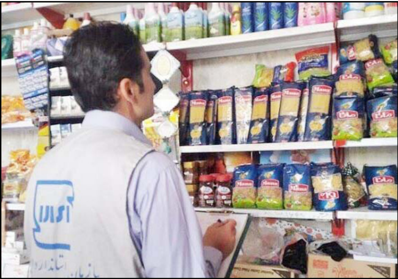
مشاور عالی سازمان استاندارد کشور گفت: یکی از مبانی اصلی توسعه، استاندارد است.

بست های استاندارد ی مواجه شود، قطعاً توسعه و هدفگذاری مدنظر کشور و استان رقم نمی خورد به همین دلیل نوع نگاه ها، رفتارها و عملکردها در امر توسعه بسیار اهمیت دارد و روش های سال های گذشته که پاسخگوی نیاز امروز ما نیست باید تغییر کند.