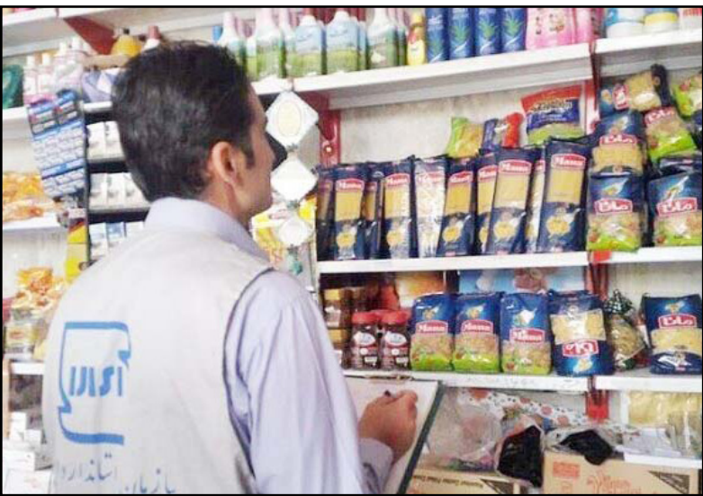
مشاور عالی سازمان استاندارد کشور گفت: یکی از مبانی اصلی توسعه، استاندارد است.

وی افزود: وقتی به شرکت سایپا در این زمینه اعتراض کردم به من اعلام کردند قیمتی که هست، سیاست های شرکت اینگونه تعیین شده و هزینه خودرو باید پرداخت شود. وی با تاکید بر اینکه من تاکید کردم که این خلاف اعلام وزارت صمت است، تصریح کرد: این شرکت اعلام کرد ما زیر نظر وزارت صمت هستیم و خودمان برای زمان دریافت پول و زمان تحویل خودرو تصمیم گیری می کنیم.