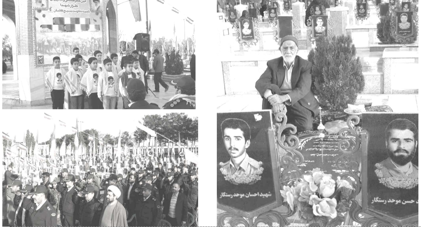
رئیس اداره ارشاد کاشان

به گزارش سراج مراسم عطر افشانی گلزار شهدای دارالسلام کاشان برگزار شدهزمان با هفته بسیج، مراسم گلباران و عطر افشانی گلزار شهدای دارالسلام کاشان با حضور فرماندار، خانواده‌های شاهد و ایثارگر و جمعی از مسئولین و مردم به منظور زنده نگه داشتن یاد و خاطره شهدا و ادای احترام و تجلیل از مقام شامخ و رفیع آنان برگزار شد.