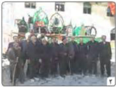
در آیین سوگواری قزاقان چه می گذرد